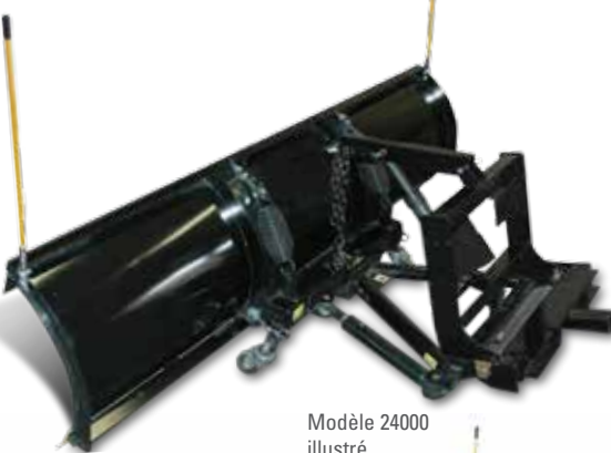
Modèle 24000 illustré