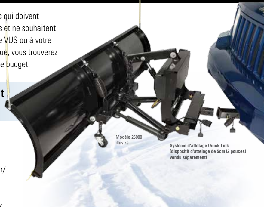
Modèle 26000 illustré

Tous les chasse-neige HomePLOW sont équipés du système Quick-Link™, un système de montage simple à utiliser qui se glisse dans un dispositif d'attelage avant de 5cm (2 pouces) de Classe 3, vendu séparément. Cela vous permet d'attacher/détacher le chasse-neige en moins d'une minute et sans outils. Le dispositif d'attelage avant doit être installé sur votre véhicule avant l'utilisation du chasse-neige HomePLOW. Consultez le site www.thehomeplow.com/WhatItFits.aspx .