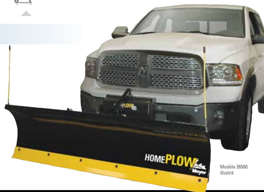
Modèle 26500 illustré

– La solution absolue en termes de commodité et de robustesse