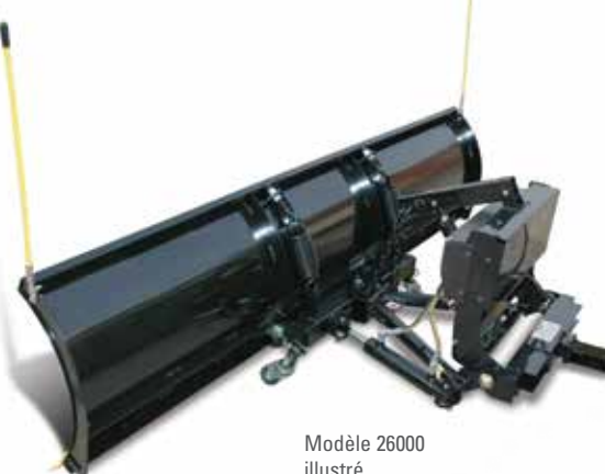
Modèle 26000 illustré

Pour consulter la gamme complète des accessoires, accédez au site: thehomeplow.com/accessories.aspx