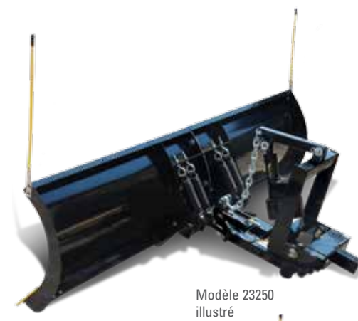
Modèle 23250 illustré